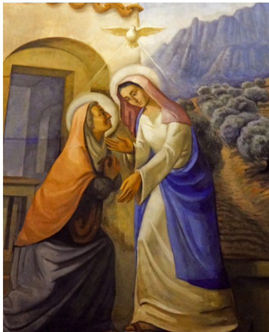
Fresc de la visitació, a la Catedral de Sant Llorenç

L'alegria és més gran quan es comparteix. Si entre nosaltres els moments d'alegria semblen desgastar-se, com qui consumeix aliments en el seu propi benefici i plaer, ara tornem a creure en l'alegria que perdura i es comparteix. Isabel i Maria